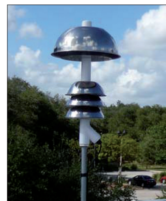
Fot. 1. Przykładowy czujnik pola elektrostatycznego

Do klasy II zaliczono czujniki wykrywające burze na etapie rozwoju poprzez detekcję wyładowań zarówno typu IC, jak i CG (fazy 2–4). Pierwsze wyładowanie doziemne poprzedzane jest często wyładowaniami między chmurami, w związku z tym wcześniejsze wykrycie IC może stanowić ostrzeżenie przed pierwszym wyładowaniem doziemnym. Detekcja obu typów wyładowań prowadzona jest w różnych zakresach częstotliwości: VHF (30–300 MHz)