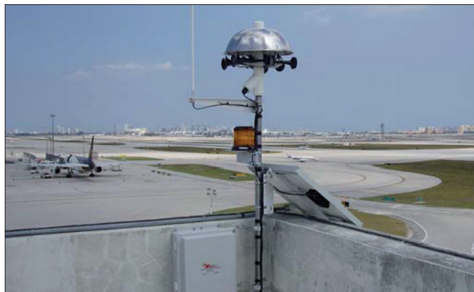
Fot. 2. Przykład stacji sygnalizacji alarmowej systemu TWS z syrenami dźwiękowymi i lampą stroboskopową

Skuteczność systemów TWS scharakteryzowana jest za pomocą czterech zdefiniowanych w normie parametrów: